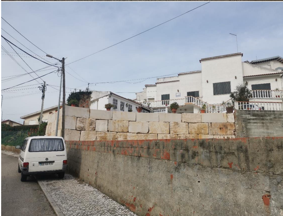
Imagens 1 e 2 – Fonte: Setor de Fiscalização (16/01/2024)