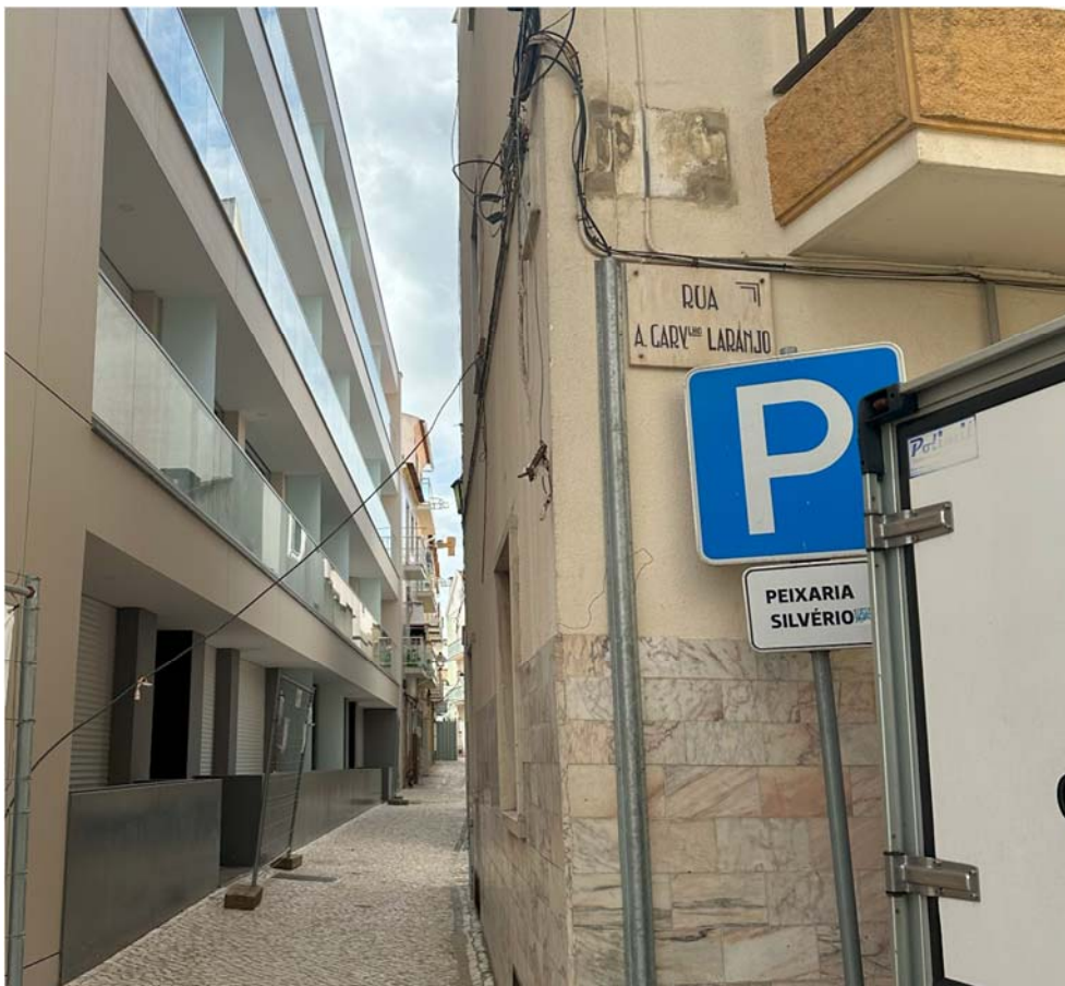
Figura 4 – Vista a partir do arruamento - Rua Dr. José Maria Carvalho Júnior.