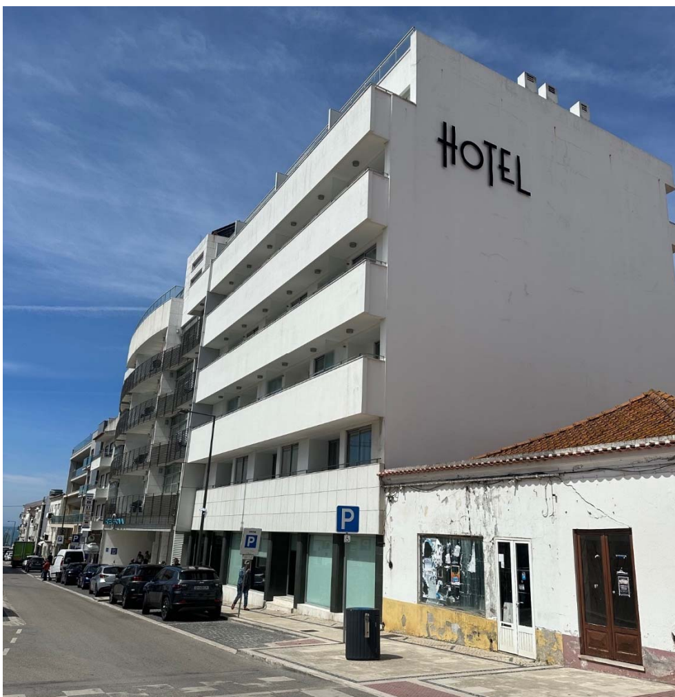
Figura 6 - Vista dos edifícios existentes no local.