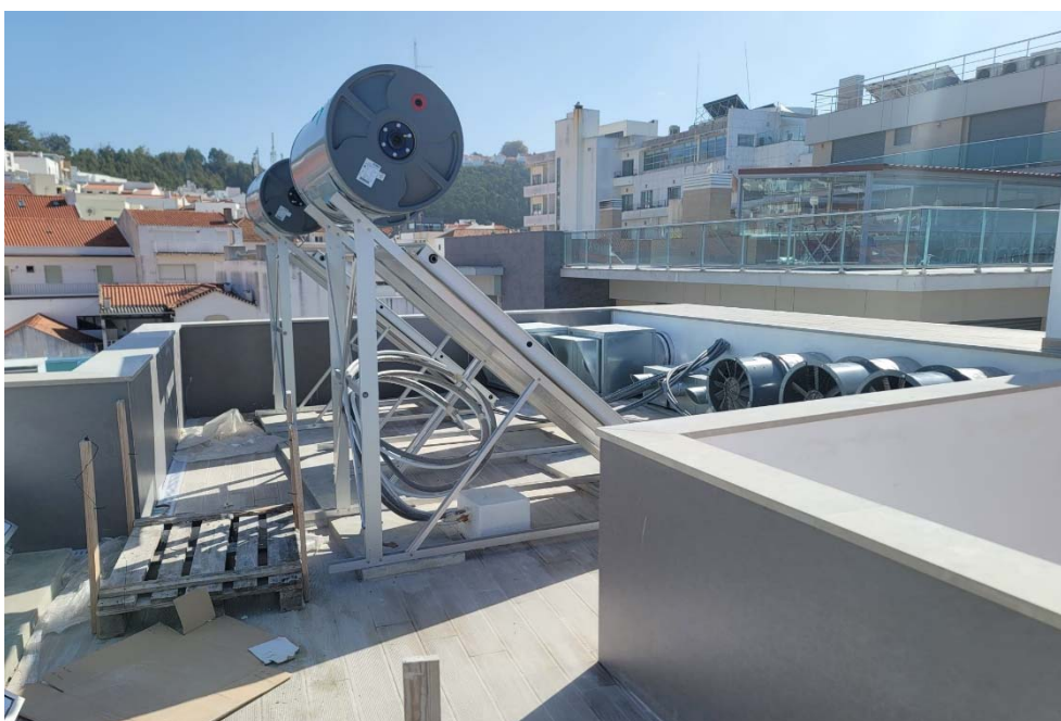
Figura 5 – Vista do edifício confinante e dos restantes edifícios com maior cêrcea.