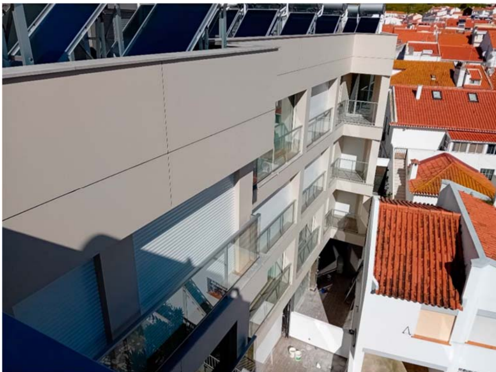
Figura 2 – Fachada a nascente - vista do logradouro (a partir de sul). Imagem extraída do Req. N.º 408/24 CMN.