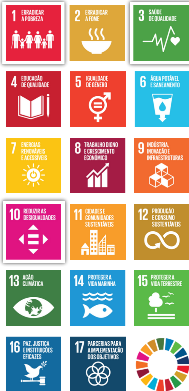
Figura 1. Representação dos 17 Objetivos de Desenvolvimento Sustentável (ODS) estabelecidos pela ONU

Nota. Esta figura mostra os 17 Objetivos de Desenvolvimento Sustentável (ODS) estabelecidos pela ONU. Adaptado de "Objetivos de Desenvolvimento Sustentável (ODS)", ods.pt (n.d.).