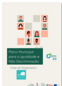
Figura 2. Diagnóstico Municipal para a Igualdade e a Não Discriminação (MIND)