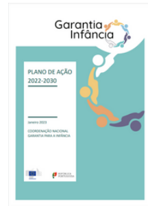
Figura 3. Plano de Ação da Garantia para a Infância (PAGPI) 2022-2030