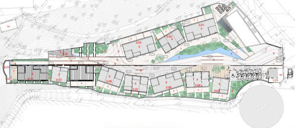
Quadro Sinóptico - Empreendimento Turístico