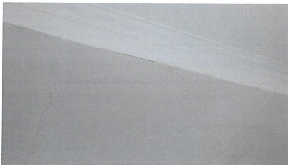
Foto n.º 1 – compartimento da sala apresentando algumas manchas na pintura e ligeiras fissuras que indiciam a existência de humidades