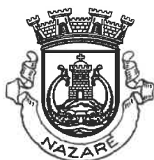
MUNICÍPIO DA NAZARÉ Câmara Municipal