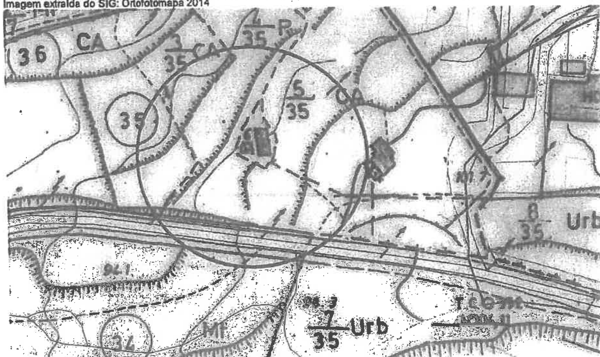
Imagem extraída do SIG: Planta Cadastral (campanha de 1986)