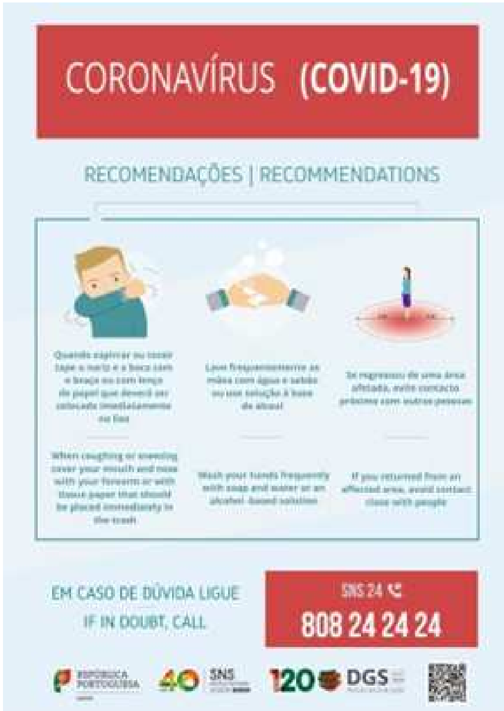
Ilustração 3 - DGS - Recomendações