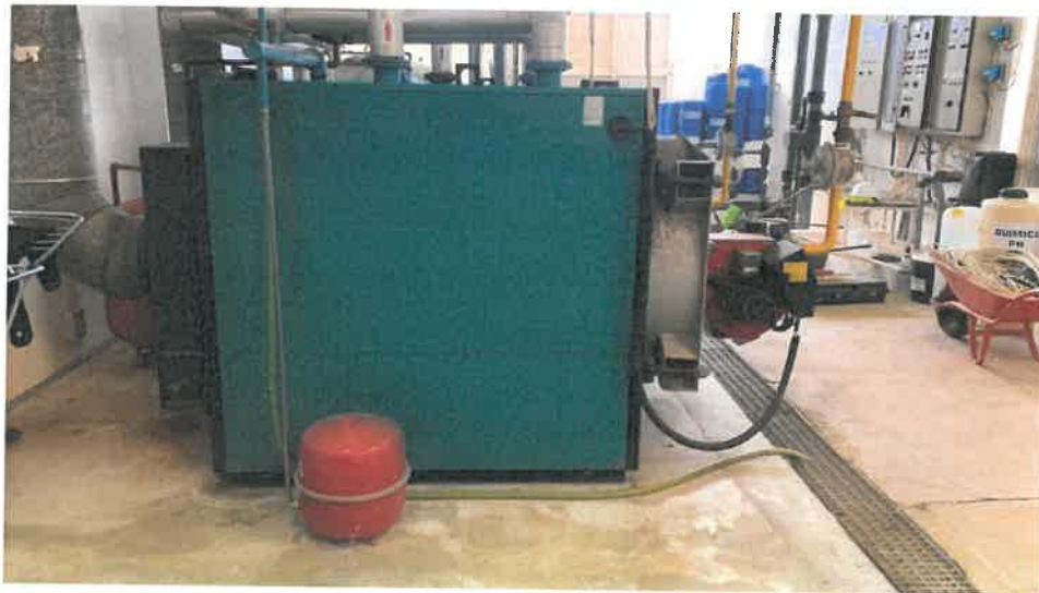
Lote 1 – Deposito AQS