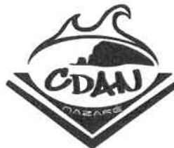
CLUBE DE DESPORTOS ALTERNATIVOS DA NAZARÉ