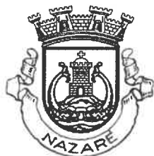
MUNICÍPIO DA NAZARÉ Câmara Municipal