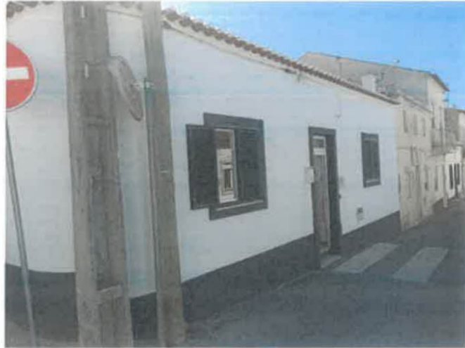
Figura 1 – Fachada Principal