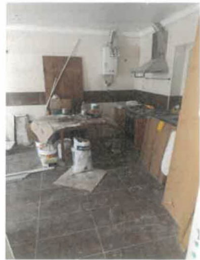
Figura 4 – Cozinha