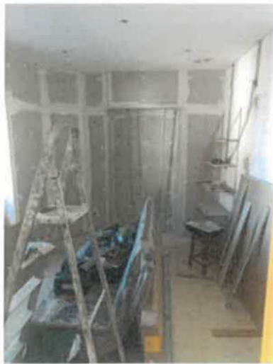
Figura 2 – Vista Interior