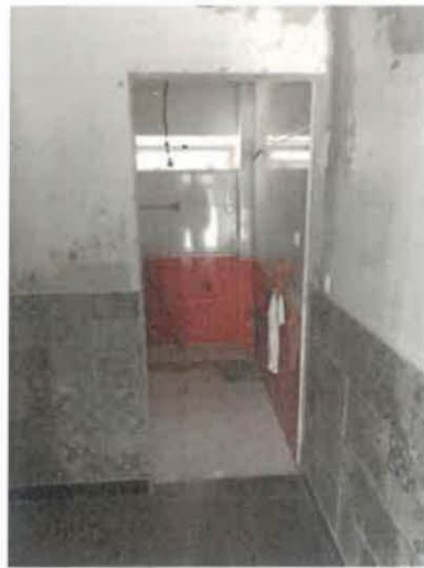
Figura 3 – Instalação Sanitária