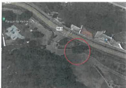
Imagem 1 - Localização do Choupo junto ao acesso lateral do Parque da Pedralva

Trata-se de uma árvore de grandes dimensões (cerca de 20m de altura), que se encontra localizada junto a uma "linha de água" artificializada.