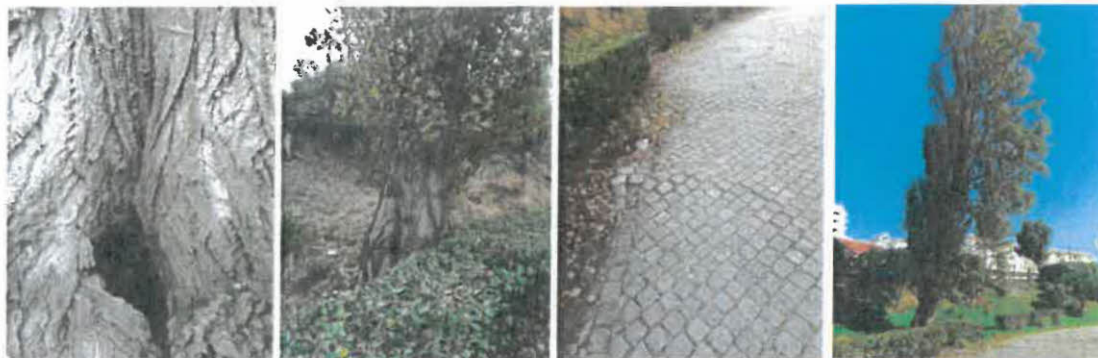
Imagem 2 e 3 – Cavidade no tronco

O sistema radicular também se encontra comprometido e tal pode-se observar na deformação do pavimento nas proximidades.