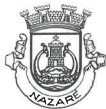
MUNICÍPIO DA NAZARÉ Câmara Municipal